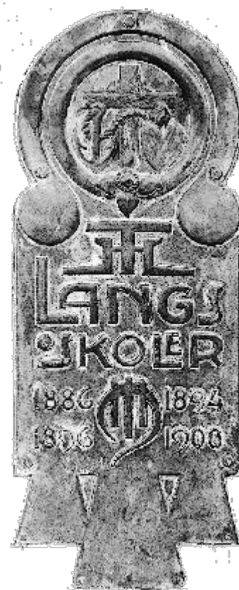
Detaljer i og omkring Th. Langs hovedbygning har rødder i jugendstilen.

Det siger sig selv, at det var et engageret og entusiastisk lærerkollegium, som samledes om skolen. Det gjaldt om at give eleverne medspil og modspil, og midlet var - bl.a. - et unikt samarbejde. Karakteristisk for skolen var en lang række,